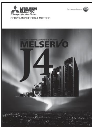
■ Catálogo: MELSERVO-J4 - L(NA)03058

■ Este catálogo fornece informações sobre os servo amplificadores da série MR-J4, servo motores, opções e outros